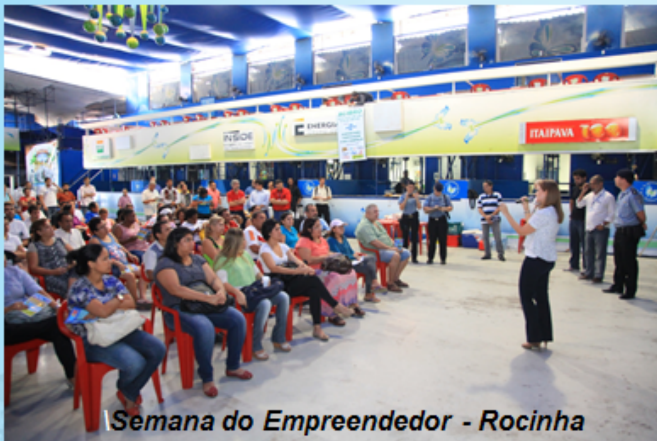
Semana do Empreendedor - Rocinha