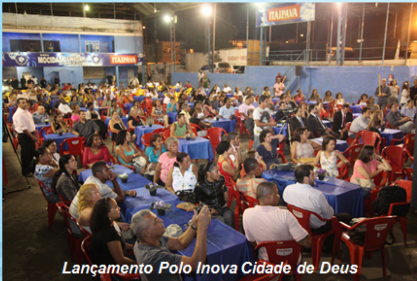
Lançamento Polo Inova Cidade de Deus